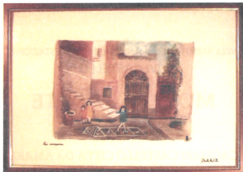
La Campana acrilico su vetro 40x50 cm.

Racconti di gesso, di vetro e di sabbia sospesi fra la realtà e la fantasia