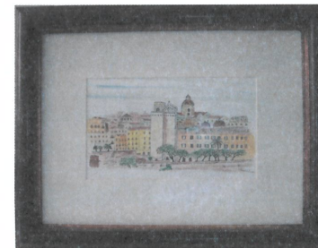
Scorci di Cagliari china e acquerello 45x37 cm.

Acquerelli, Tempere e Chine Espressioni di stato d'animo e sguardi di colore