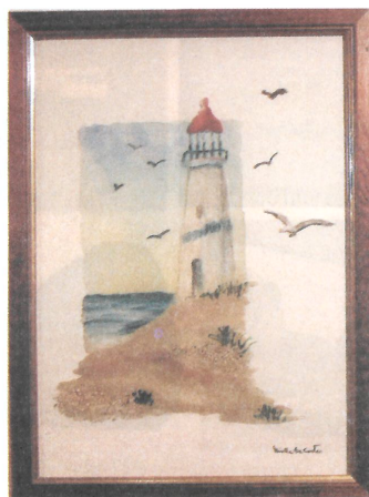
I Gabbiani tecnica mista su sabbia 38x28 cm.